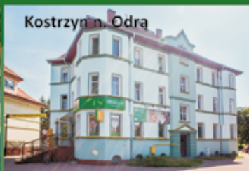
Kostrzyn n. Odra