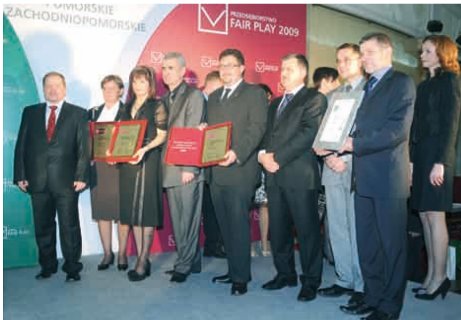
Laureaci konkursu A.D. 2009

Trzydzieści jeden lubuskich firm zostało wyróżnionych w tegorocznej XII edycji konkursu „Przedsiębiorstwo Fair Play”. Gala finałowa odbyła się 4 grudnia br. w sali Kongresowej Pałacu Kultury i Nauki w Warszawie.