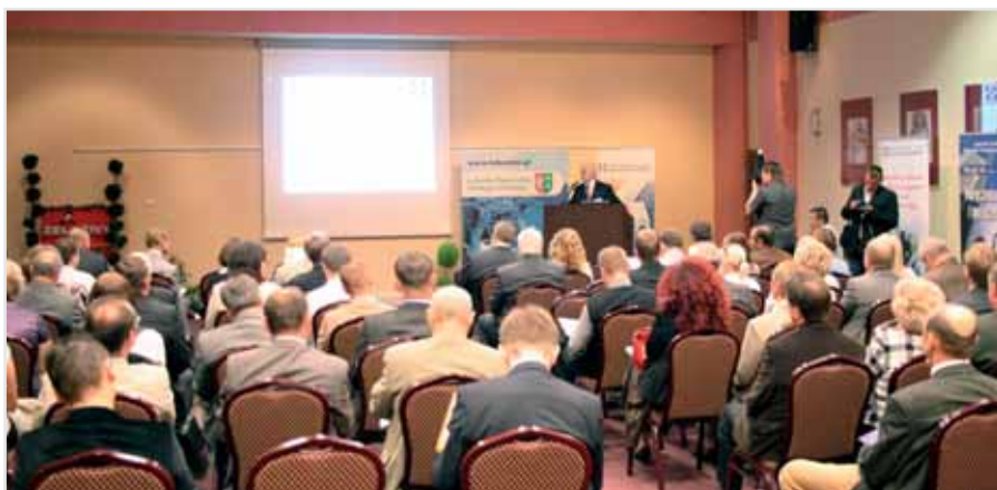
Konferencja otwierająca projekt Budowa Lubuskiego Systemu Innowacji

„Budowa Lubuskiego Systemu Innowacji” Program Operacyjny Kapitał Ludzki Działanie 8.2 Transfer wiedzy, Poddziałanie 8.2.2 Regionalne Strategie Innowacji