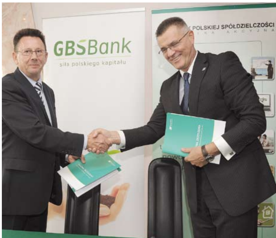
Uroczyste podpisanie umowy o zmianie zrzeszenia.

Bank Polskiej Spółdzielczości S.A. reprezentuje polski sektor bankowości spółdzielczej poprzez członkostwo w Komitecie Wykonawczym Confédération Internationale des Banques Populaires – CIBP, międzynarodowej organizacji zrzeszającej banki spółdzielcze z 18 krajów na całym świecie.