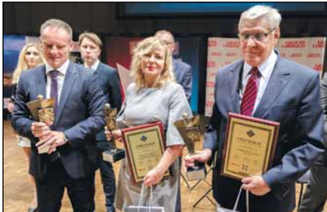
Laureaci w kategorii: Mikro przedsiębiorstwa