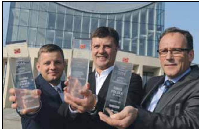
Lubuscy Liderzy Innowacji 2014