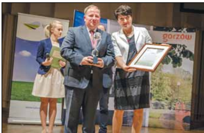
Upominki z okazji 10-lecia ZIPH