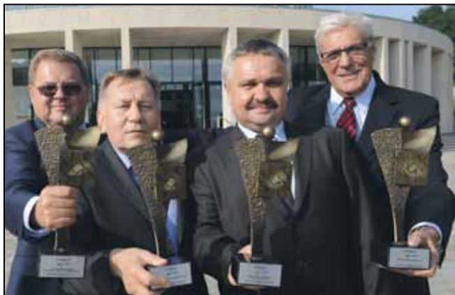
Lubuscy Liderzy Biznesu 2014