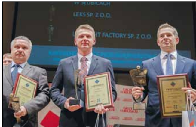
Laureaci w kategorii: Duże przedsiębiorstwa