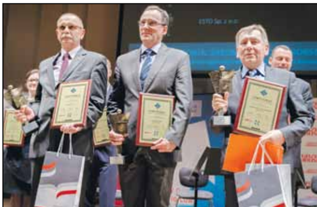
Laureaci w kategorii: Średnie przedsiębiorstwa