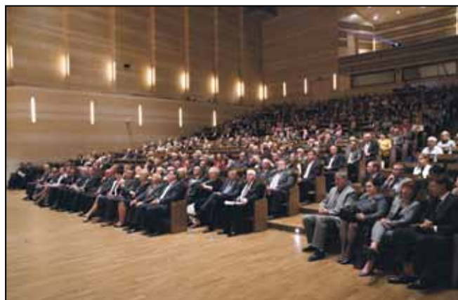
VI Gala Lubuskiego Lidera Biznesu zgromadziła blisko 500 gości