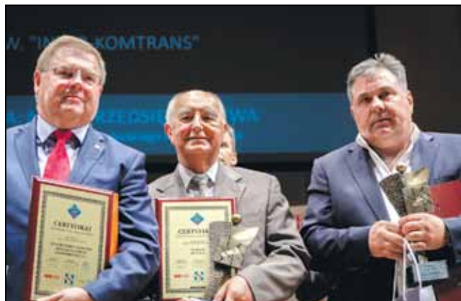
Laureaci w kategorii: Małe przedsiębiorstwa