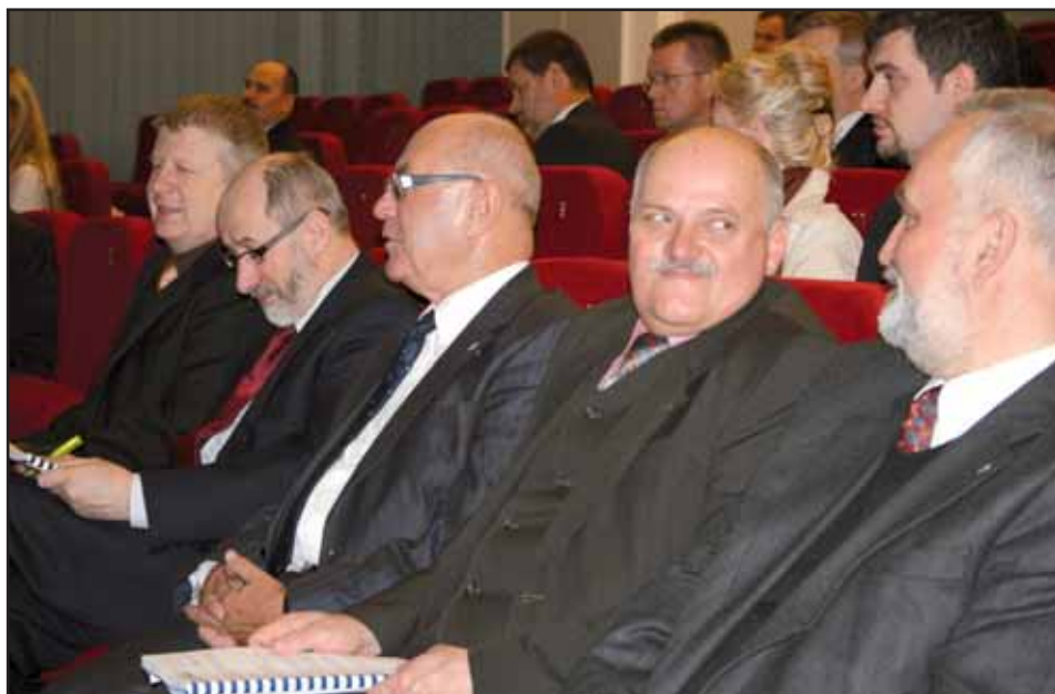
Goście honorowi Walnego Zgromadzenia.