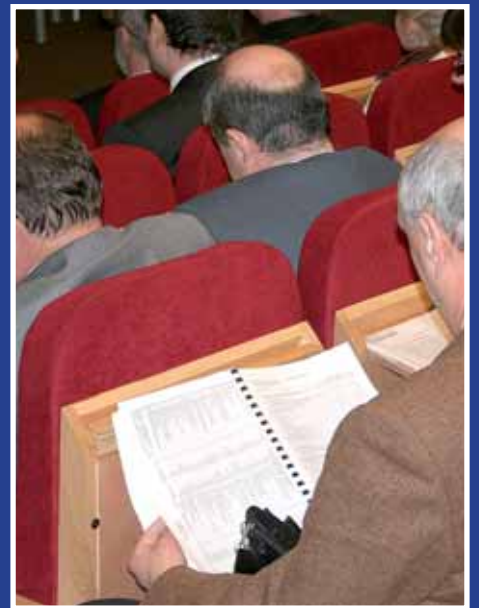
Członkowie Izby analizują materiały sprawozdawcze.