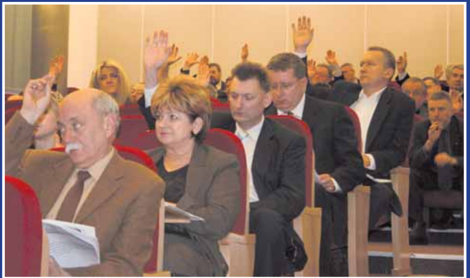
Głosowanie nad przyjęciem jednej z uchwał.

- Chciałem pogratulować Izbie bardzo dobrych wyników i podkreślić bardzo dobrą współpracę z Lubuskim Sejmikiem Gospodarczym. Im prężniejsze będą organizacje tego typu, tym my, jako Lubuski Sejmik Gospodarczy, będziemy mieli większą siłę oddziaływania na władze województwa. Gratuluję jeszcze raz.