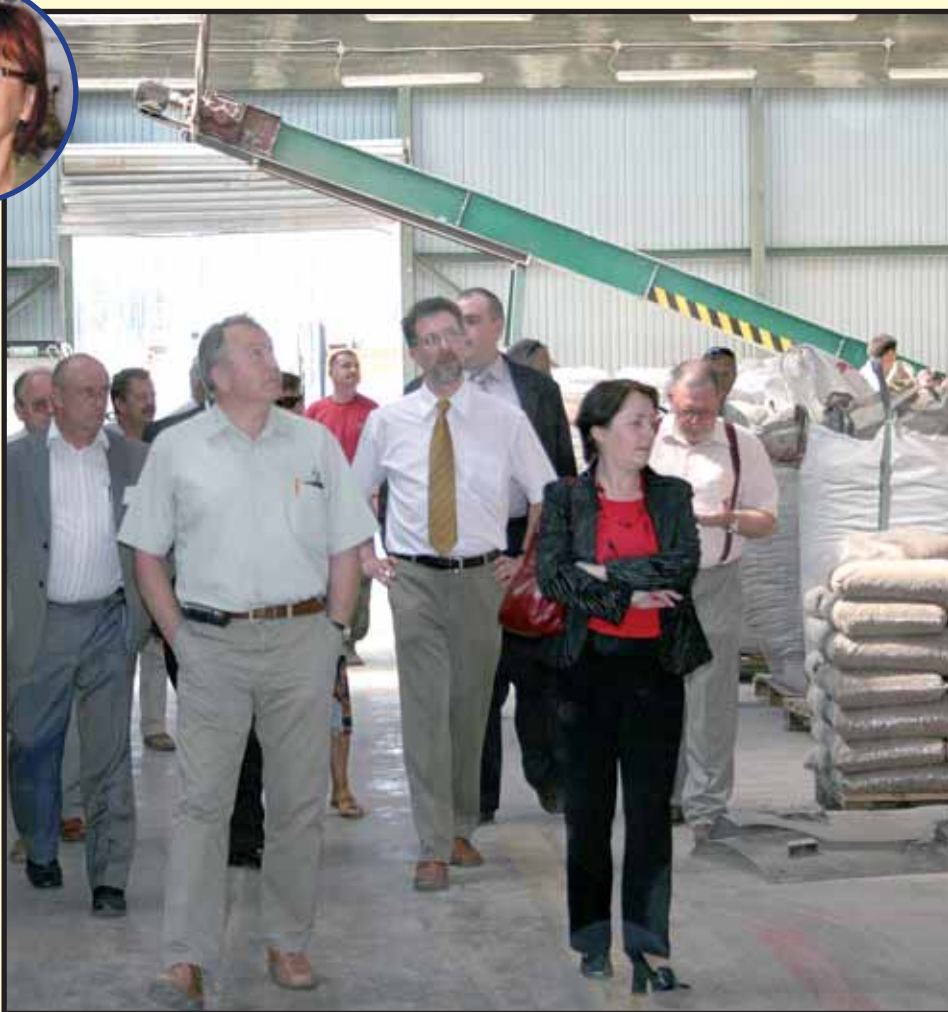
Zwiedzanie zakładu Pellet-Art Sp z o.o