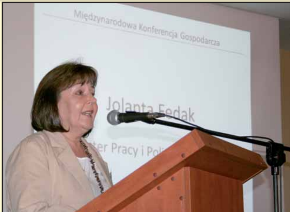
Minister Pracy i Polityki Społecznej Jolanta Fedak