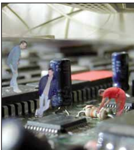
Innowacja w zasięgu ręki

Natomiast austriacki ekonomista Joseph Schumpeter twierdzi, iż innowacja to istotna zmiana funkcji produkcji, polegająca na odmiennym, niż uprzednio, kombinowaniu tzn. łączeniu ze sobą czynników produkcji. Autor ten podkreśla że innowacja stanowi za każdym razem niepowtarzalny czyn, a zmiany nie mają charakteru ciągłego. Inni autorzy zauważają w tym zjawisku także pierwiastek twórczy i kreatywny. Tak więc