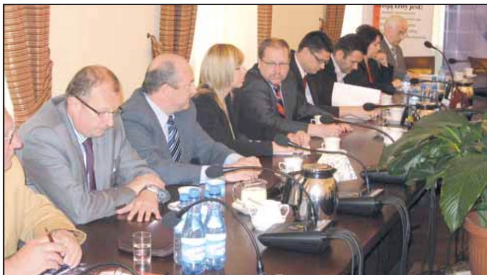
Podczas konferencji omówiono bieżącą działalność Izby

Myślę, że nasza wizyta była owocna zarówno dla nas – władz samorządowych, jak i dla przedsiębiorców. Udało się nam nawiązać pierwsze kontakty. Dla przykładu powiem, że gorzowska firma Agroma, która zajmuje się maszynami rolniczymi jest w przeddzień podpisania umowy handlowej. Podobnie jest z firmą branży spożywczej Leks Sp. z o.o. z Sulęcina, która również porozumiała się w sprawie wymiany handlowej. Myślę,