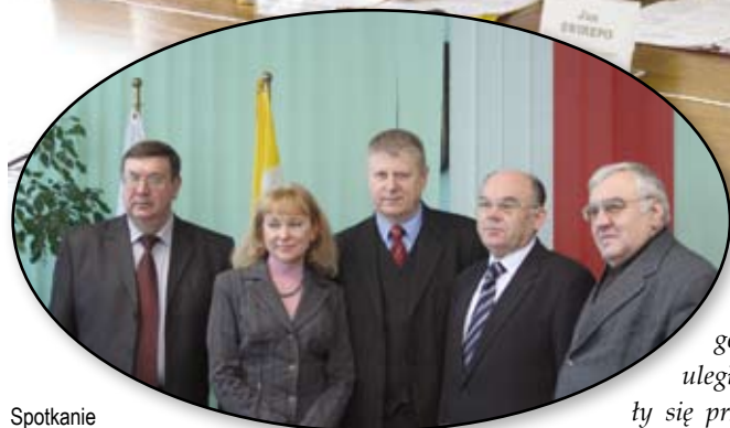
Spotkanie z przedsiębiorcami w Lubuskim Urzędzie Wojewódzkim w Gorzowie Wlkp.

Obwód homelski leży na wschodzie Białorusi. Zamieszkuje go blisko 1,5 mln mieszkańców. Pod względem gospodarczym to jeden z najsilniejszych regionów wschodniego sąsiada Polski. Zachodnia Izba Przemysłowo-Handlowa współpracuje na bieżąco z Białoruskim Oddziałem Izby Przemysłowo-Handlowej w Homlu. Kontakty pomiędzy województwem lubuskim i obwodem homelskim utrzymywane są również na poziomie samorządowym.