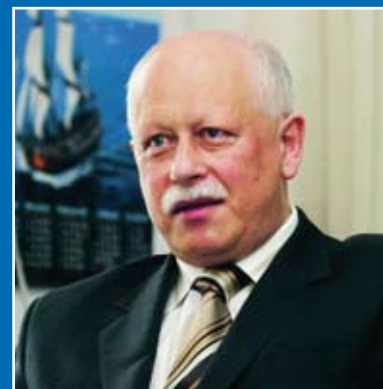
Piotr Styczeń, Wiceminister Infrastruktury RP:

W ykład inauguracyjny wygłosił właśnie minister Styczeń. Zwrócił w nim uwagę na wsparcie legislacyjne, jakie rząd Rzeczypospolitej Polskiej udziela branży mieszkaniowej. Przedstawiciel rządu zapewnił także o swojej otwartości na inicjatywy ustawodawcze wynikające z dialogu z firmami operującymi na rynku nieruchomości.