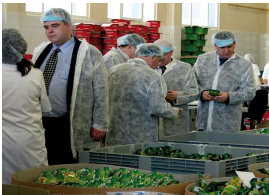
Delegacja białoruska podczas zwiedzania Podravki w Kostrzynie n.Odrą