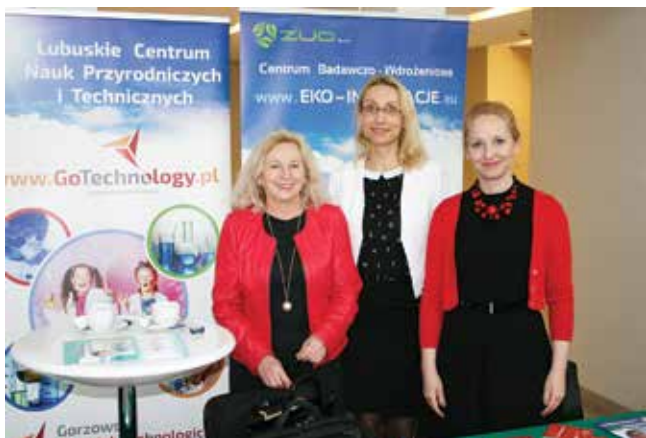
Stoisko Gorzowskiego Ośrodka Technologicznego