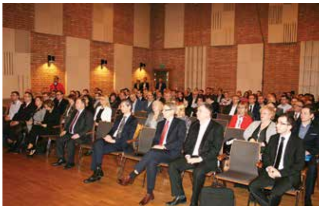
Konferencja zgromadziła ponad 150 uczestników