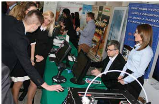
Dużym zainteresowaniem cieszyły się stoiska lubuskich uczelni