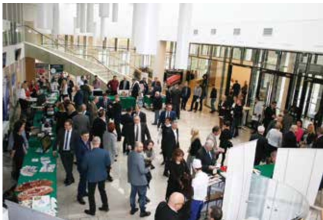
W holu uczestnicy mieli możliwość zapoznania się z ofertą lubuskich uczelni, parków technologicznych i firm