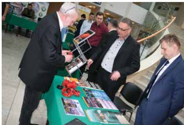
Stoisko firmy Victaulic z Drezdenka