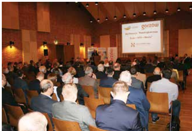
Uczestnicy mieli okazję wysłuchać wielu interesujących wystąpień