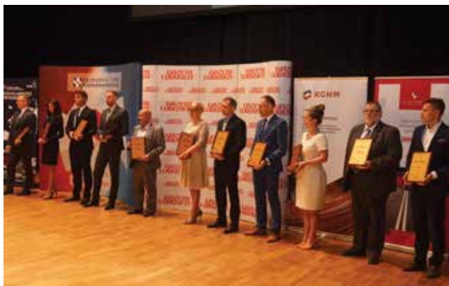
Laureaci w kategorii Mikro przedsiębiorstwa