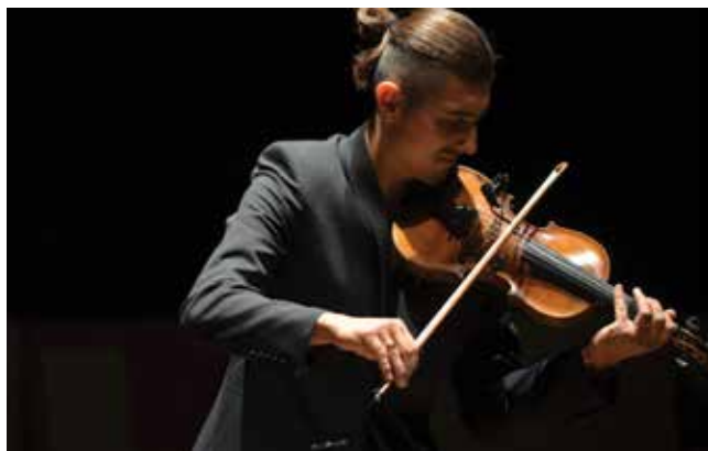
Galę uświetnił występ uznanego za jednego z najważniejszych skrzypków jazzowych na świecie, gorzowianina Adama Bałdycha