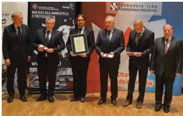
Gala była okazją do wręczenia odznak Krajowej Izby Gospodarczej oraz medali z okazji 25-lecia polskiej transformacji