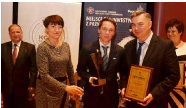
Największym zwycięzcą tegorocznej gali okazała się spółka Borne Furniture z Gorzowa, która wygrała w kategorii Dużych przedsiębiorstw oraz uzyskała laur Lubuskiego Lidera Innowacji