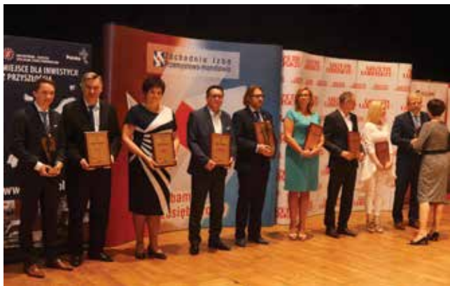
Laureaci konkursu w kategorii Duże przedsiębiorstwa