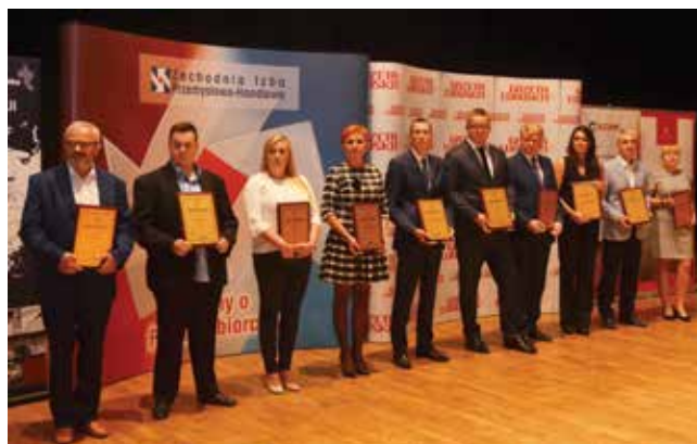
Laureaci konkursu w kategorii Małe przedsiębiorstwa