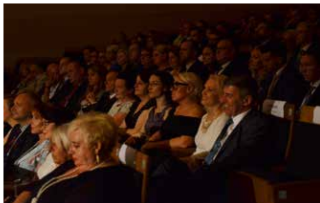
W święcie lubuskiego biznesu uczestniczyło blisko 300 zaproszonych gości