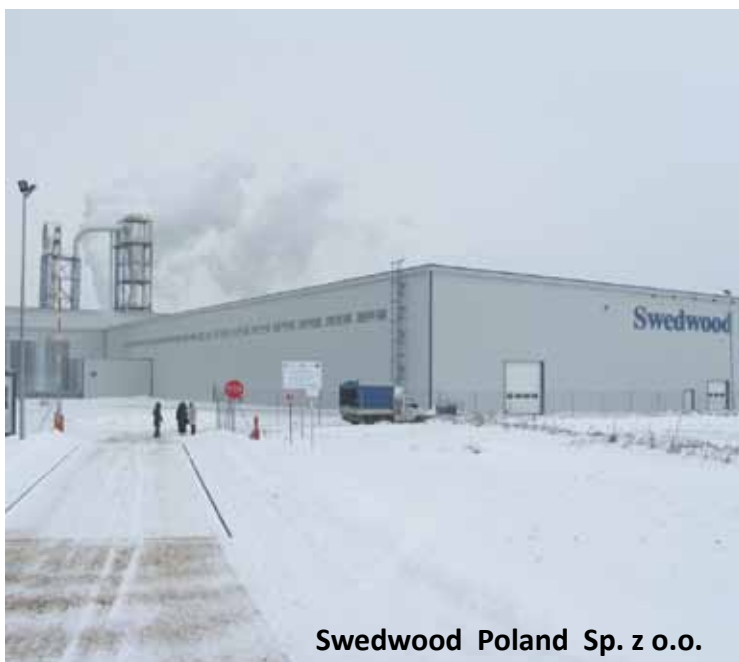
Swedwood Poland Sp. z o.o.