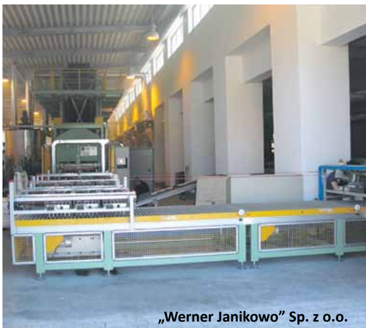
„Werner Janikowo” Sp. z o.o.