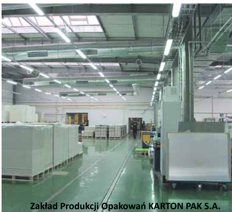
Zakład Produkcji Opakowań KARTON PAK S.A.