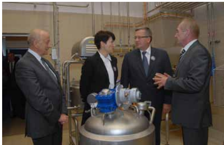
Uroczyste otwarcie Ośrodka

Część ta stanowi szeroką ofertę Ośrodka w zakresie oznaczania ilościowego i jakościowego (HPLC) różnych składników oraz oznaczania metodą GC związków lotnych. Z kolei w ramach laboratorium mikrobiologicznego oraz biologii molekularnej możliwe jest oznaczanie ogólnej liczby drobnoustrojów,