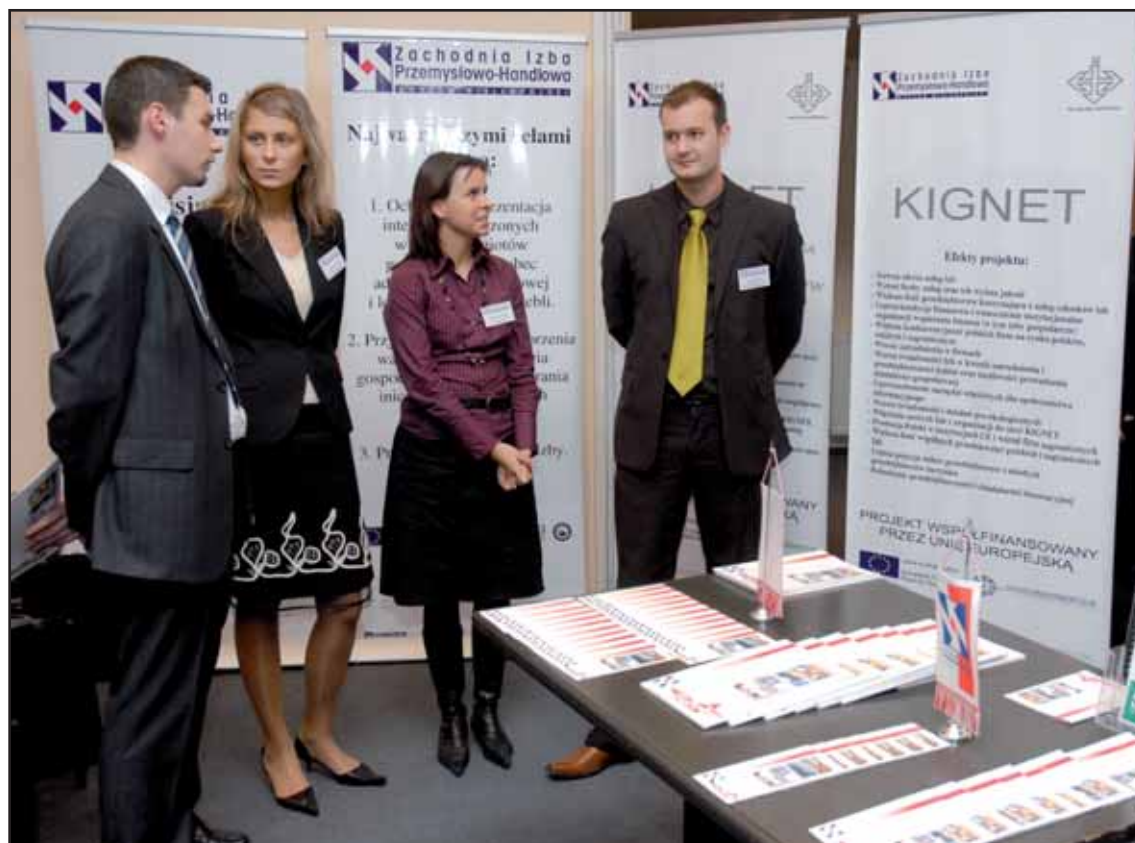
Pracownicy Izby na stoisku KIGNET