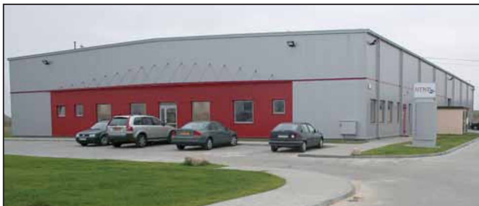
Siedziba High Tech Mechatronics Poland Sp. z o.o.