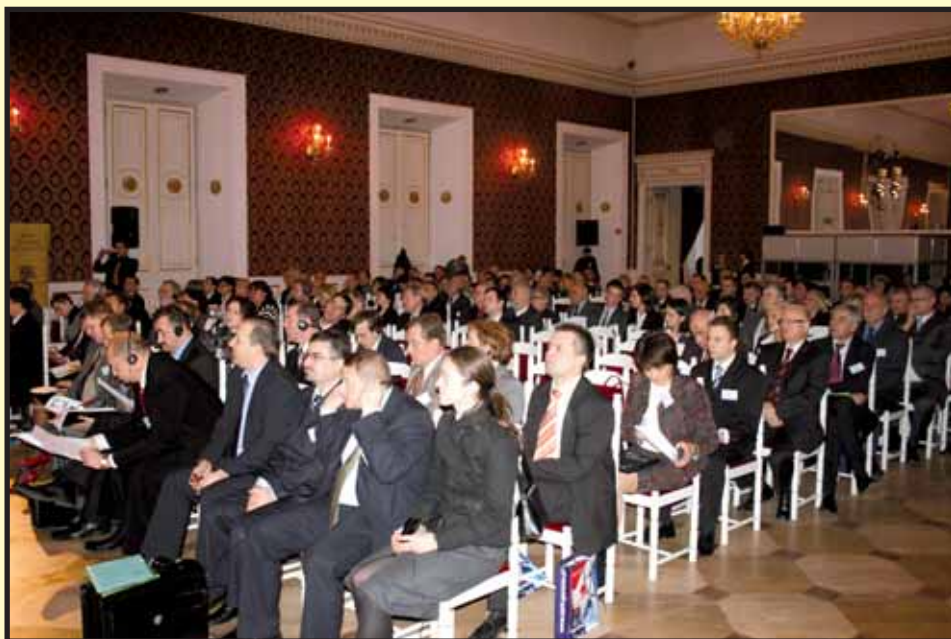
W konferencji udział wzięło ponad 200 gości.

Podczas konferencji oferty inwestycyjne i propozycje wspólnych działań zaprezentowały Obwody z Homla, Iwanofrankowska, Kiszyniowa, Pskowa, Sum i Samorządowego Kraju Nitrzańskiego. Podpisano również porozumienia. Marszałek Województwa Lubuskiego podpisał porozumienia o współpracy z Obwodem Homelskim na Białorusi i Sumskim na Ukrainie. Zachodnia Izba Przemysłowo-Handlowa podpisała porozumienie o współpracy z Homelskim Oddziałem Białoruskiej Izby Przemysłowo-Handlowej. Ustalony został program pracy na przyszły rok. To konkretne spotkania i projekty, a przede wszystkim wymierne interesy dla przedsiębiorców.