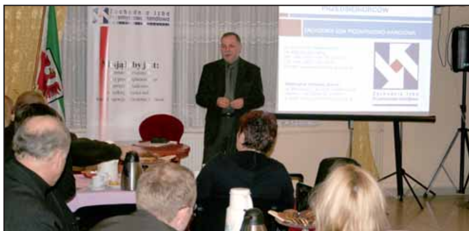
Przy kawie o prawie

Wychodząc naprzeciw oczekiwaniom przedsiębiorców Zachodnia Izba Przemysłowo-Handlowa wspólnie z Kancelarią Górecki, Radziejewski, Wiśniewski s.c. Adwokaci, Radcowie Prawni, Doradcy Podatkowi uruchomiła cykl bezpłatnych spotkań pod nazwą „Przy kawie o prawie – wtorki z prawem gospodarczym”.