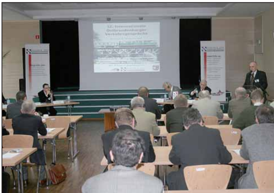
Konferencja w ramach Międzynarodowych Wschodniobrandenburskich Rozmów Transportowych

niósł 40% wzrost szeregów członkowskich. Obecnie jest nas już ponad dwustu przedsiębiorców. Mimo krótkiego stażu mamy solidne podstawy funkcjonowania, bogate doświadczenie w pomocy przedsiębiorcom i realizacji projektów unijnych. Dobrze współpracujemy z partnerami zagraniczny-