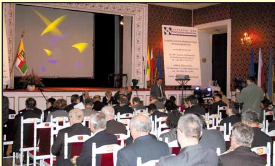
Uczestnicy konferencji podczas obrad.