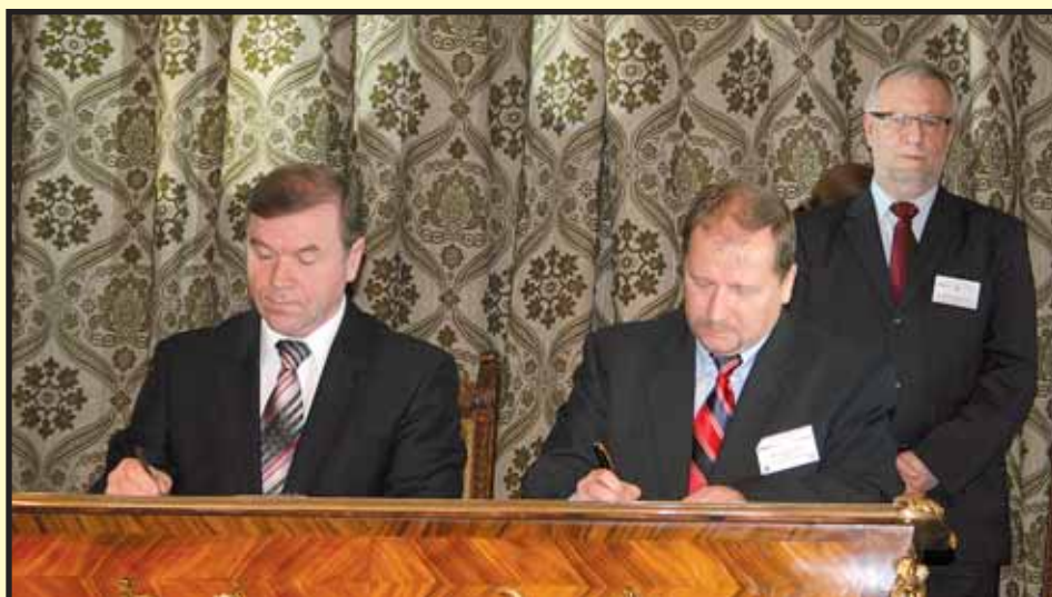
Podpisanie porozumienia pomiędzy ZIPH a Izbą Przemysłowo-Handlową w Homlu.

Gospodarczej. Głos zabrała Komisarz Unii Europejskiej ds. współpracy regionalnej - Danuta Hübner, która po raz pierwszy pojawiła się z oficjalną wizytą w naszym województwie. - Lubuskie musi jeszcze nadrobić wiele zaniedbań. Ale są na to pieniądze. Zresztą samorządowcy w tym regionie wiedzą, jak dobrze wykorzystywać unijne fundusze - powiedziała Pani Komisarz.