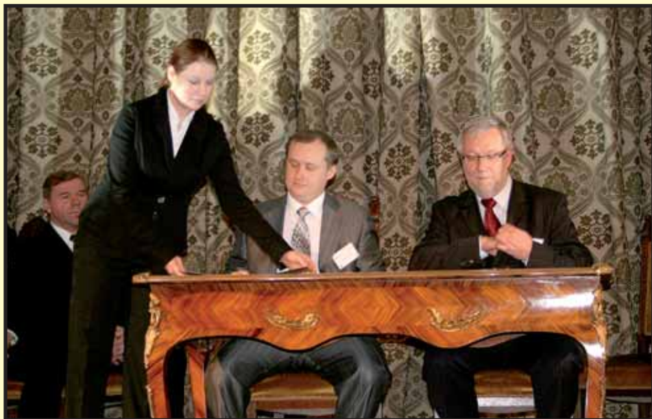
Podpisanie porozumienia pomiędzy Województwem lubuskim i Obwodem Sumskim na Ukrainie.

Podczas konferencji oferty inwestycyjne i propozycje wspólnych działań zaprezentowały Obwody z Homla, Iwanofrankowska, Kiszyniowa, Pskowa, Sum i Samorządowego Kraju Nitrzańskiego. Podpisano również porozumienia. Marszałek Województwa Lubuskiego podpisał porozumienia o współpracy z Obwodem Homelskim na Białorusi i Sumskim na Ukrainie. Zachodnia Izba Przemysłowo-Handlowa podpisała porozumienie o współpracy z Homelskim Oddziałem Białoruskiej Izby Przemysłowo-Handlowej. Ustalony został program pracy na przyszły rok. To konkretne spotkania i projekty, a przede wszystkim wymierne interesy dla przedsiębiorców.