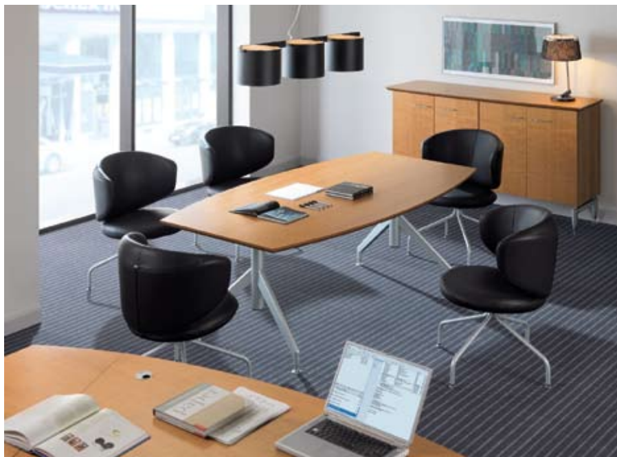
Mirage Manager - konferencja (współpraca)

Zapraszamy, by przekonać się, jak estetyczne i funkcjonalne może być biuro.