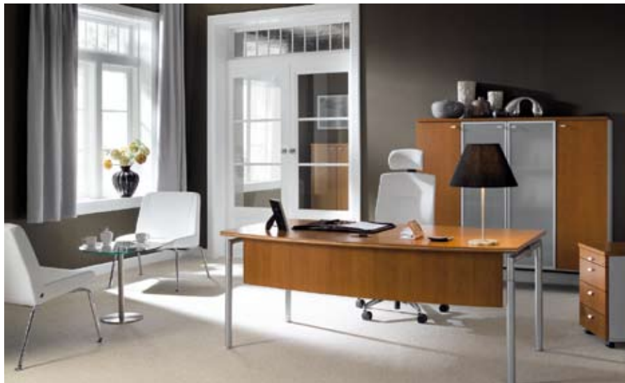
Oko Manager - gabinet (prywatność)

Sztuka doboru formy mebla, jego gabarytów, kolorystyki oraz ustawienia wszystkich elementów jest podstawą dobrego projektu. To przede wszystkim miejsce pracy wpisane w kulturę organizacyjną firmy i powinno być jej integralną częścią pod wzglę-