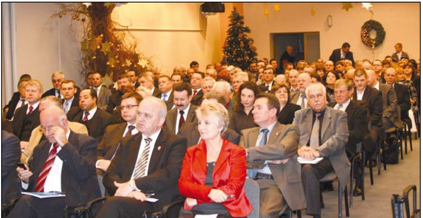
Uczestnicy IV Regionalnego Spotkania Przedsiębiorców