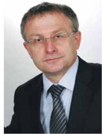
KANCELARIA PRAWNICZA GÓRECKI IPARTNERZY Adwokaci i Doradca podatkowy

Wyżej opisane zasady są w miarę jasne. Ustawodawca - jak niestety to zazwyczaj bywa - nie ustrzegł się błędów i pozostawił lukę, która w praktyce może nastęrczyć wiele trudności interpretacyjnych. Ustawodawca wprowadził bowiem zapis, który stanowi, że przy ustalaniu długości okresu wypowiedzenia umów o pracę na czas określony, trwających w dniu wejścia w życie noweli, nie uwzględnia się - począwszy od dnia wejścia w życie noweli - okresów zatrudnienia u danego pracodawcy przypa-