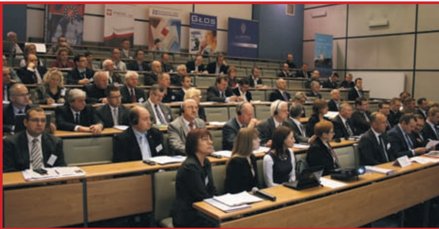
Druga część konferencji poświęcona była bezpieczeństwu przeciwpowodziowemu Odry