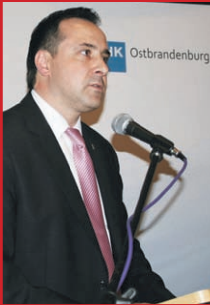
Piotr Luczyński, zastępca Burmistrza Ślubice