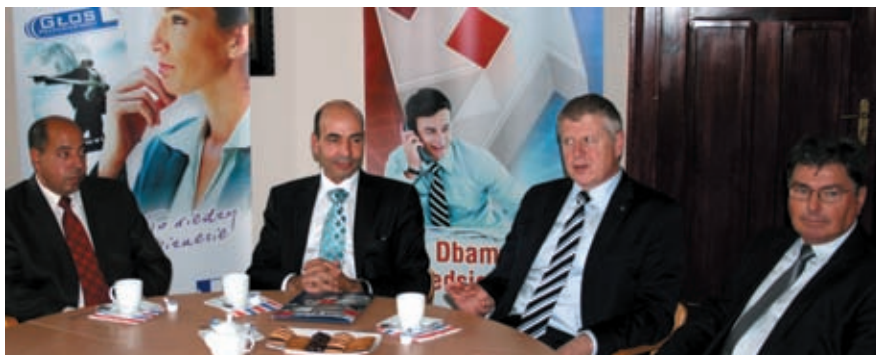
Spotkanie w gorzowskiej siedzibie ZIPH