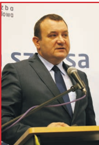
Stanisław Gawłowski, Sekretarz Stanu Ministerstwo Środowiska RP