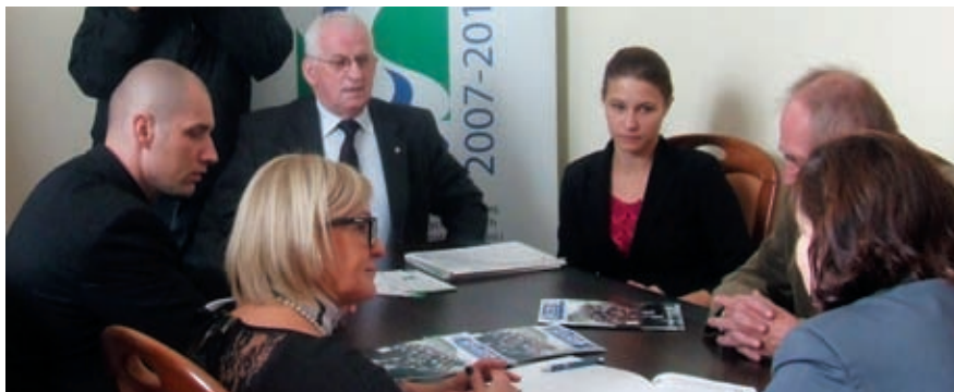
Podpisanie umowy o współpracy w sulechowskiej PWSZ

Podpisane porozumienie zakłada między innymi prowadzenie badań w laboratoriach Lubuskiego Ośrodka Innowacji i Wdrożeń Agrotechnicznych oraz podejmowanie współpracy w zakresie transferu wiedzy do gospodarki. Jednocześnie przedsiębiorstwo wyraziło zainteresowanie kształceniem studentów na kierunku Technologia Żywności i Żywnienie Człowieka ze szczególnym uwzględnieniem profilu firmy „Zyguła” pod kątem perspektywy zatrudnienia absolwentów Sulechowskiej PWSZ. Studenci mogliby także odbywać praktyki zawodowe i sprawdzać swoją wiedzę w praktyce w jednym z największych zakładów masarskich w regionie. Szczególne korzyści mogłyby przynieść prace