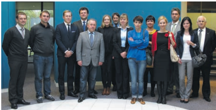
Uczestnicy lubuskiej delegacji w Cambridge

Jednostka odpowiedzialna za transfer i upowszechnianie wiedzy. IfM ECS obejmuje zespół doświadczonych specjalistów – praktyków. To oni ściśle współpracują z wszystkimi zainteresowanymi, aby zapewnić bezproblemową wymianę pomysłów między przemysłem, a uniwersytetem. Ponadto placówka nawiązuje współpracę z firmami za pośrednictwem programu edukacji i usług doradztwa, kursów itp. Projekty obejmują zakres od drobnych usprawnień operacyjnych dla lokalnych firm do poważnych zmian ustawienia biznesowego korporacji wielonarodowych. Taki model