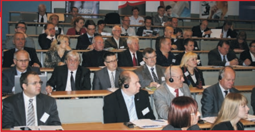
Konferencja zgromadziła liczną rzeszę polskich i niemieckich przedsiębiorców