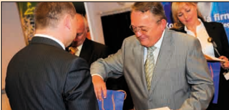
Nagrodzeni w kategorii „Przedsiębiorstwa Mikro”

Przedstawiciele zwycięzców w poszczególnych kategoriach powiedzieli nam: