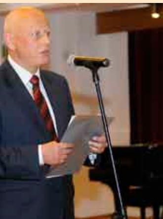
Minister Infrastruktury Piotr Styczeń

strona 1.000.00 zł Przedsiębiorstw Dużych"