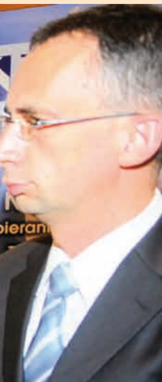
a wręczenia certyfikatów